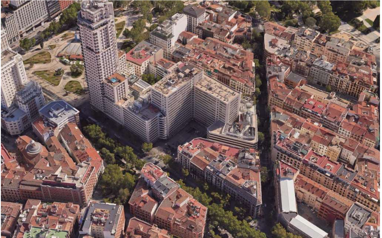
FOTOGRAFÍA AÉREA DE LA SITUACIÓN DEL INMUEBLE

El edificio se sitúa en la Calle Princesa nº 5, Distrito de Moncloa-Aravaca, en el Municipio de Madrid.